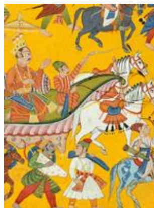
Le roi Dasaratha et sa suite en route pour le mariage de Rama. Inde, circa 1690-1710. Encre et gouache sur papier. Dimensions : 22,2 x 31,8 cm

http://www.metmuseum.org/special/se_event.asp?OccurrenceId={D7754927-FF57-4445-AACC-FBABB8EC3947}